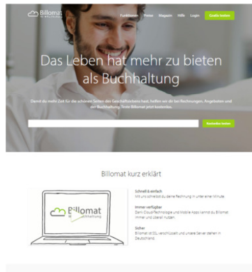
Das neue Design